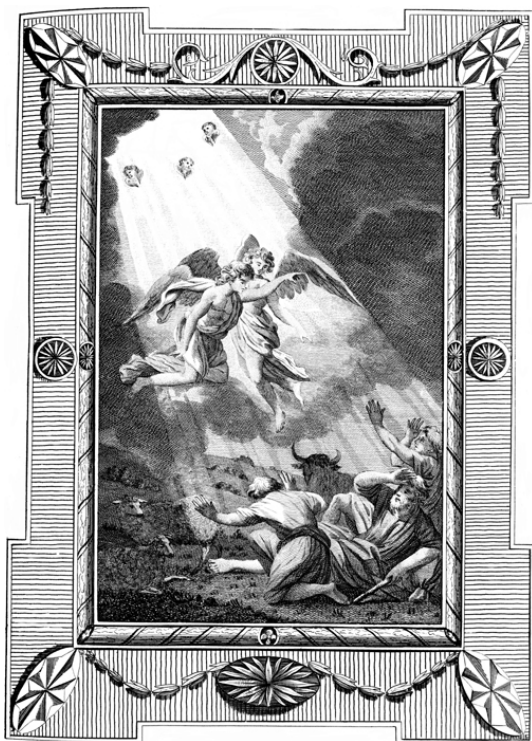
Wright, Paul: Andělé zvěstují pastýřům